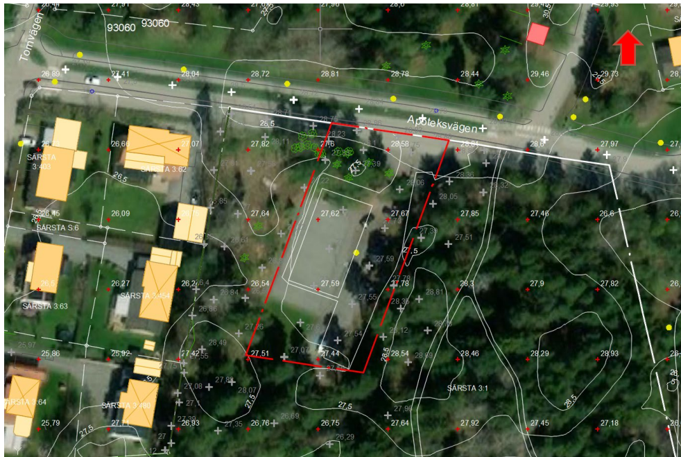
Figur 2. Aktuell område [2].