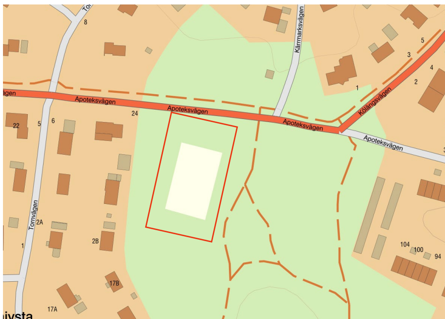
Figur 1. Översiktsskarta över Särsta 3:1, Knivsta, undersökningsområdet är inringat i rött.