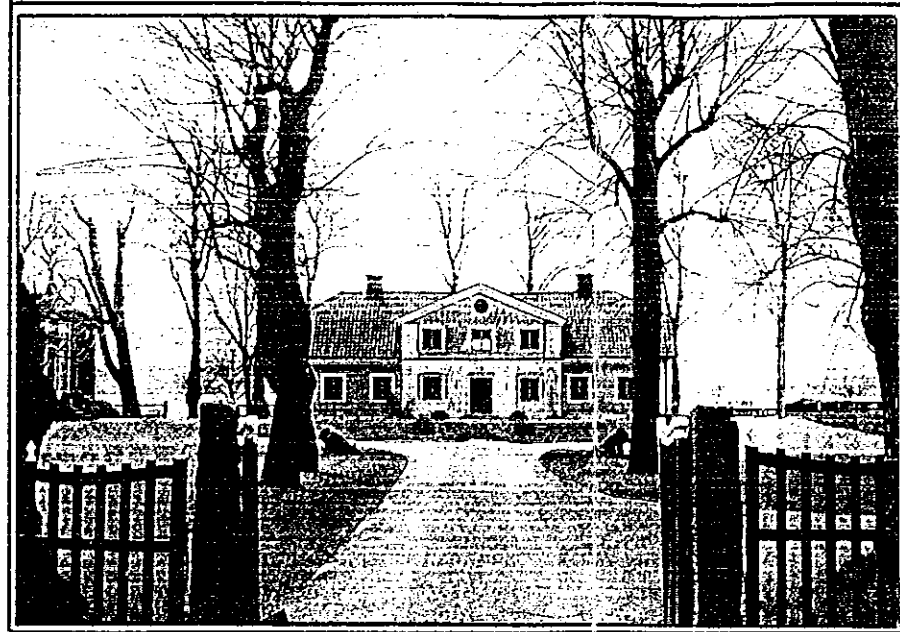
Huvudbyggnaden vid Kvallsta.

En områdesbestämmelse som intas som planbestämmelse får inte ifrågasättas vid efterföljande detaljplaneläggning.