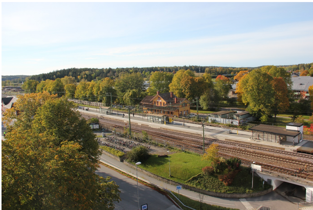
Järnvägen i centrum.

År 2017 tecknade Knivsta kommun ett avtal med staten och Region Uppsala. I det så kallade fyrspårsavtalet åtog sig kommunen att möjliggöra för 15 000 nya bostäder i en blandad och hållbar stadsstruktur fram till år 2057. I gengäld ska staten bidra med olika infrastrukturella satsningar i kommunen, bland annat att bygga ut järnvägen från två till fyra spår genom kommunen, uppföra en station i Alsike och tillse en god kollektivtrafik. En förbättrad infrastruktur mellan Stockholm och Uppsala är central för utvecklingen av det nav som huvudstadsregionen utgör.